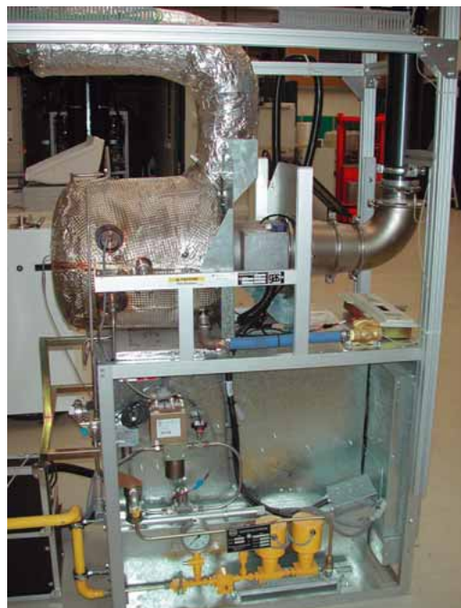
Abbildung 4 Mikrogasturbine des ISET, zur Zeit in der Praxiserprobung mit Biogas