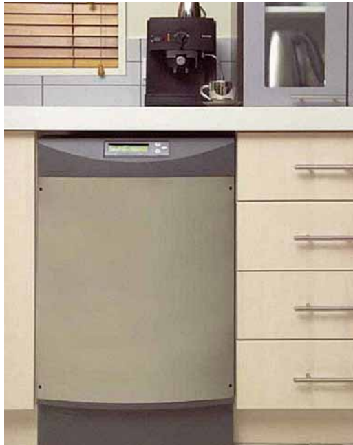
Abbildung 1 Stirlingaggregat für Erdgasbetrieb als Untertischgerät

oder anderen Liegenschaften mit hoher Wärmegrundlast. Eine Übersicht über marktverfügbare sowie neue Mikro-KWK-Technologien auf Motorbasis enthält die abgebildete Tab 1 .