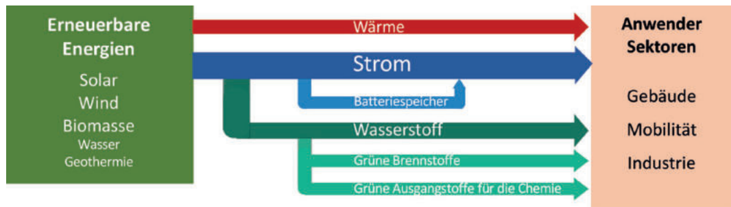
Abbildung 1: Zukünftige Energiesysteme: schematische Darstellung