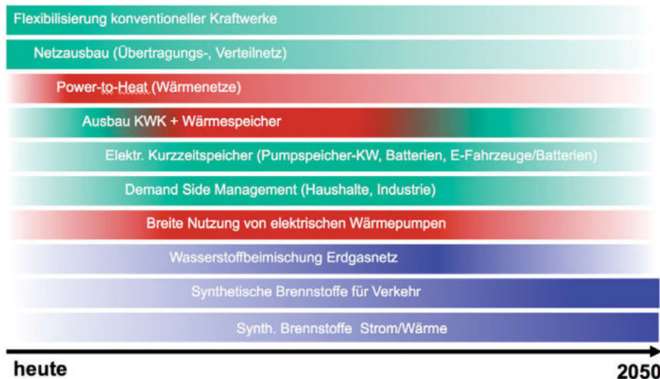
Abbildung 3 Flexibilitätsoptionen bei Strombereitstellung und -nutzung