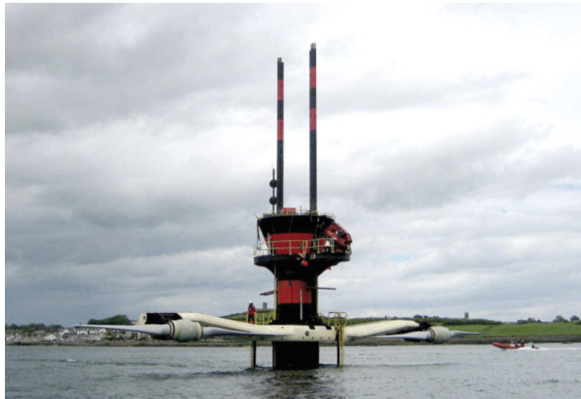
Abbildung 3 Die Meeresströmungsturbine SEAGEN

Der Schlüssel zu einer vertrauensvollen Zusammenarbeit ist das gegenseitige Verständnis der jeweiligen Ziele und Randbedingungen und der Wille, Kompromisse einzugehen und Gemeinsamkeiten zu suchen. Dies ist nur mit einer kontinuierlichen, engen und langen Zusammenarbeit möglich, wie sie in RAVE im Koordinationsgremium stattgefunden hat. Zusätzlich wurde ein für Forschungsverhältnisse sehr umfangreiches Vertragswerk geschaffen und ein detailliertes Verfahren zur Akkreditierung von Forschern für sensible Daten ausgearbeitet.