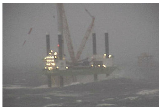
Abbildung 1 Der Windpark alpha ventus bei verschiedenen Wetterlagen – die extremen Umweltbedingungen offshore sind die größte Herausforderung