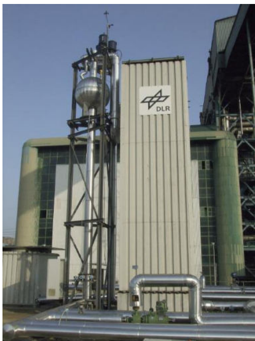
Abbildung 3 700 kWh Latentwärmespeicher mit 700 kWh Kapazität für die Speicherung von Dampf bei 100 bar

Thermochemische Energiespeicher haben das Potential, Wärmespeicher mit extrem hoher Speicherdichte (Faktor 10–20 gegenüber sensiblen Speichern, Faktor 3–5 gegenüber Latentwärmespeichern) zu realisieren. Darüber hinaus sind sie zur Wärmetransformation geeignet, indem thermische Energie bei höherer Temperatur ausgekoppelt werden kann. Um die Basis für eine technologische Umsetzung zu schaffen, müssen für relevante Anwendungsbereiche die optimalen Reaktionssysteme identifiziert und die verfahrenstechnischen und wärmetechnischen Entwurfsgrundlagen entwickelt werden. Beim DLR werden