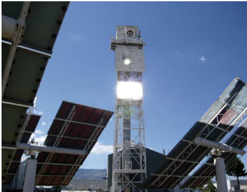
Abbildung 4 Solarthermische Wasserstoffproduktion auf einem Solarturm der Plataforma Solar de Almería