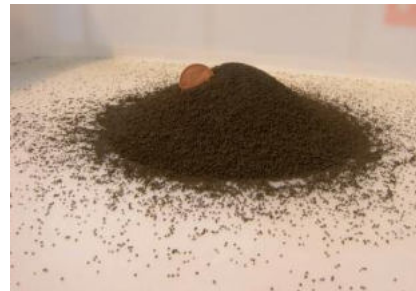
Abbildung 2 links: Schema für einen Hochtemperatur- partikelreceiver rechts: mögliche Partikel

Dabei werden thermische Energiespeicher mit 12–15 h Speicherkapazität den Solarstrom für fast 8000 h/Jahr sicherstellen. Der verbleibende Regelstrom muss durch vergleichsweise schnell regelbare konventionelle Kraftwerke bereit gestellt werden, d.h. die Nutzbarkeit von Kern- und Kohlekraftwerken wird stetig abnehmen. Die spezifischen Kosten für das Solarkraftwerk müssen gleichzeitig bis 2050 um mehr als 60 % fallen, um eine wirtschaftliche Lösung zu erreichen.