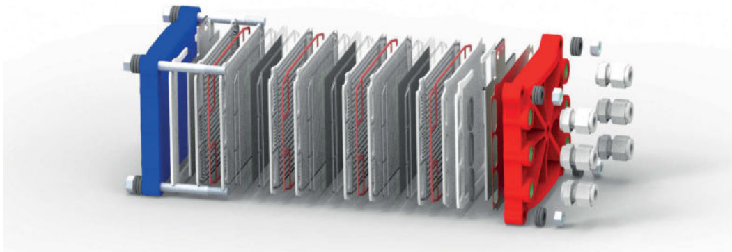
PEMFC-Brennstoffzellen aus dem ZSW

Brennstoffzellen wandeln einen Brennstoff zusammen mit (Luft-)Sauerstoff in Strom und Wärme um. Sie können je nach Brennstoffzellentyp entweder mit Wasserstoff oder mit kohlenwasserstoffhaltigen Brennstoffen wie Methanol, Erdgas, Benzin oder Diesel betrieben werden.