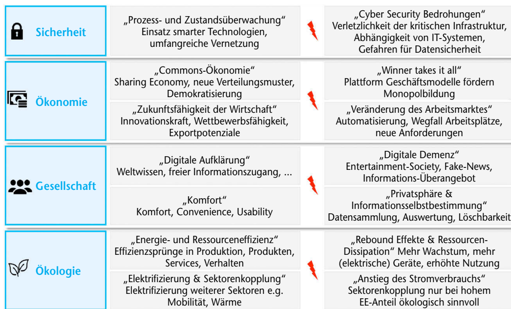
Abbildung 1 Spannungsfelder der Digitalisierung im Energiesektor (eigene Darstellung)

Als Folge der Smart Meter-Installation und der somit verfügbaren Informationen über den zeitlichen Stromverbrauch ergeben sich Möglichkeiten für Smart Home-Systeme und -Services welche auf Kundenbedürfnisse fokussiert sind. Im Kern zentralisieren Smart Home-Systeme die Bedienung verschiedener Anwendungen wie Licht, Heizung, Lüftung sowie „smarter“ (Haushalts-)Geräte um den Komfort beispielsweise durch ortsunabhängige Steuerung zu steigern und den Energieverbrauch sowie die Kosten durch erhöhte Verbrauchs- und Kostentransparenz