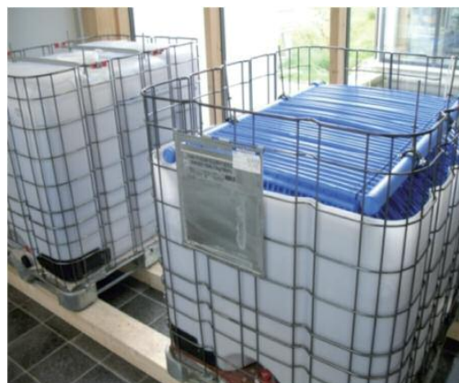
Latentwärmespeicher mit Calcium-Chlorid zur Rückkühlung eine Absorptionskältemaschine zur solaren Klimatisierung (ZAE Bayern)

Die Umwandlung der verschiedenen Energieformen – elektrisch, elektrochemisch, mechanisch, chemisch oder thermisch – bietet neue Möglichkeiten der effizienten Energiespeicherung. So kann z. B. erneuerbar erzeugte Elektrizität, wenn diese kurzzeitig nicht ins Netz einspeisbar ist, nach der Umwandlung in Wärme oder Kälte dezentral, kostengünstig und effizient thermisch gespeichert werden. Auch Sonnenwärme von über 400 °C kann in thermischen Speichern aufgehoben und in der Nacht der Turbine wieder zugeführt werden. Damit werden die Effizienz und vor allem die Laufzeit von solarthermischen Kraftwerken deutlich erhöht. Durch die Möglichkeit der Umwandlung der Energieformen kann das technisch und ökonomisch am besten geeignete Speicherkonzept realisiert werden.