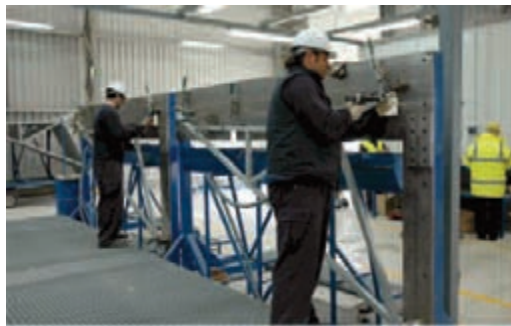
Abbildung 4 und 5 Einstellvorrichtungen (jigs) für die Serienfertigung