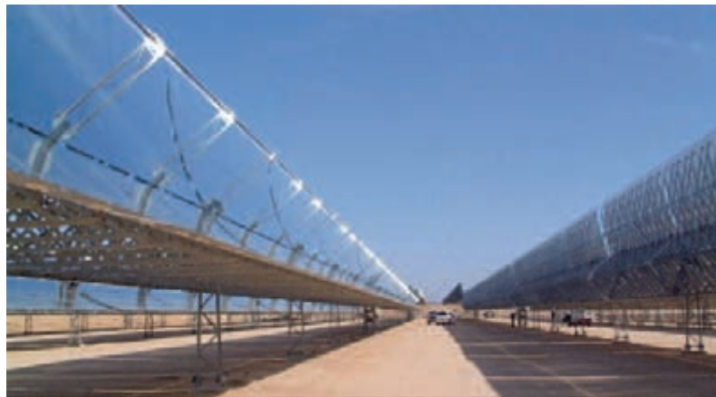
Abbildung 2 Parabolrinnen- kollektoren eines solarthermischen Kraftwerkes