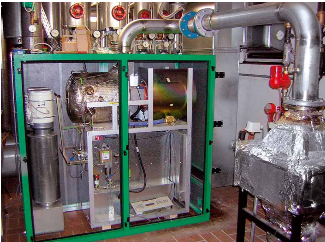
Abbildung 3 Pilotprojekt Biogasbetriebene Mikrogasturbine im ISET [8]

Es eignet sich nicht jedes Aggregat für jeden biogenen Brennstoff. Die verschiedenen biogenen Brennstoffe unterscheiden sich neben dem Aggregatzustand hinsichtlich ihres Heizwertes, ihrer Verbrennungseigenschaften (Zündverhalten, Flammgeschwindigkeiten, Ausbrand usw.) aber auch hinsichtlich ihrer unerwünschter Begleitstoffe und Verbrennungsrückstände (Teer, Asche). Weiterhin besteht das Problem, dass die Qualität biogener Brennstoffe oftmals Schwankungen unterlegen ist.