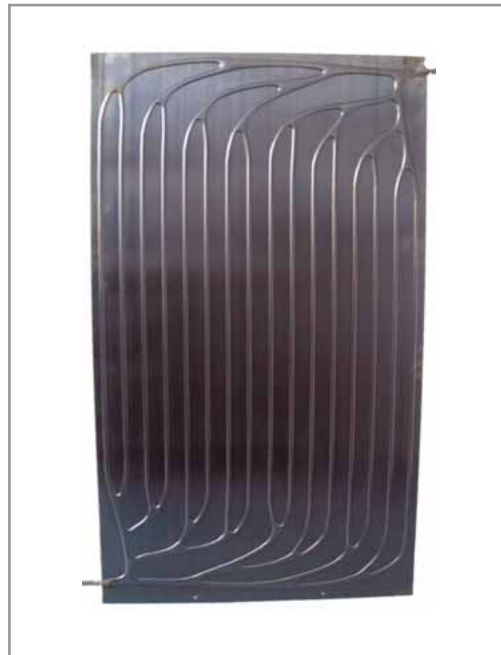
Abbildung 4 Absorber mit bionischer Strömungsstruktur

Ein Solarkollektor mit bionischen Strömungsstrukturen wird derzeit am Fraunhofer ISE entwickelt [6]. Natürliche Konstruktionen weisen im Gegensatz zu üblichen seriellen oder parallelen Kanalanordnungen in Solarabsorbern meist mehrfach verzweigte („fraktale“) Netzwerke auf. Im Rahmen eines von der DBU geförderten Projekts wird dieses biologische Prinzip auf