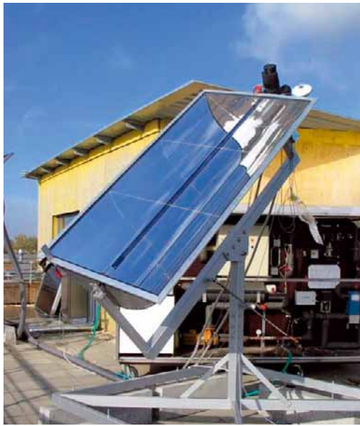
Abbildung 5 Parabolrinnenkollektor des SIJ (Prototyp)

Folgende Konzepte sind in der Entwicklung: