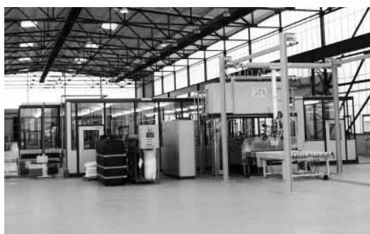
Abbildung 5 Die Laminierstrecke. Rechts der Einlauf, Wäsche der Deck- gläser

Sites, J.R., Lui, X., (1995), Performance Comparison Between Polycrystalline Thin-film and Single-crystal Solar Cells, Progress in Photovoltaics, 3, 307 - 314