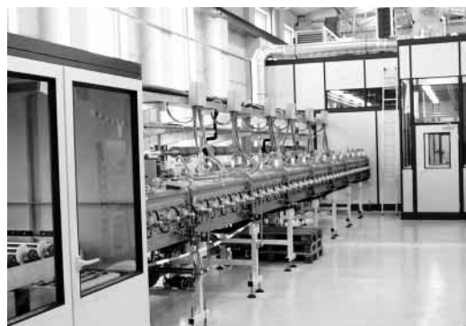
Abbildung 4 Detail der Produktionslinie: Links der Auslauf der Laserstrukturierung, Mitte die Aufheiz- strecke für die CSS Prozeßeinheit