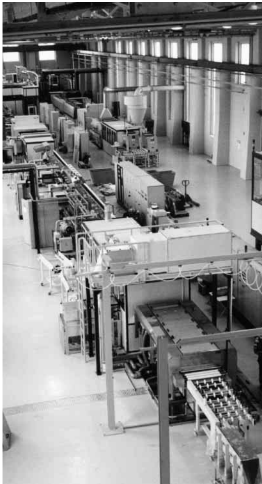
Abbildung 3 → Die Produktionslinie A für CdTe Dünnschichtmodule